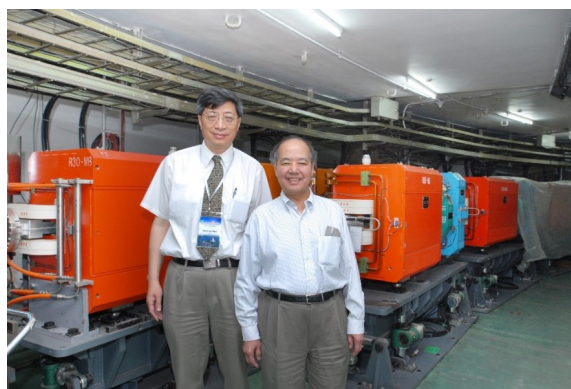
图 1 2006 年 6 月,李政道视察 BEPC 隧道

直线加速器于 2007 年 12 月通过验收。BESIII 于 2009 年 4 月 2 日通过中科院验收。2008 年 7 月 16 日, BEPCII 实现了存储环的第一次对撞。2009 年 5 月, BEPCII 的亮度达到验收指标 3 \times 10^{32} \text{cm}^{-2} \text{s}^{-1} , 李政道先生立即发来了贺信(图 3),表示热烈的祝