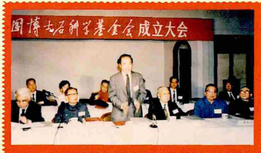
1990年5月，中国博士后科学基金会正式成立，李政道在成立大会上讲话。