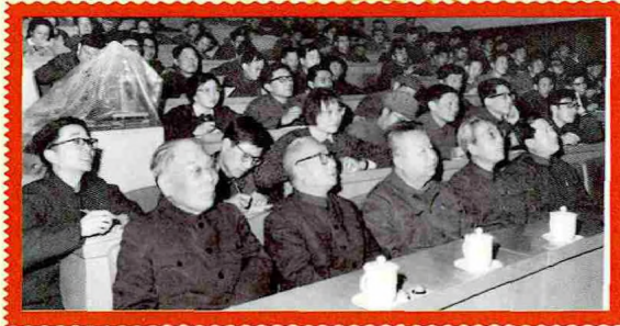
1979年春，李政道利用暑假期间假期，在北京科学会堂讲授《统计力学》及《场论和粒子物理学》两门课程。