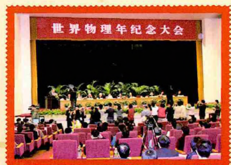
2005年4月15日，李政道在中国科学技术协会、中国科学技术部等联合主办的世界物理年纪念大会上发表讲话。