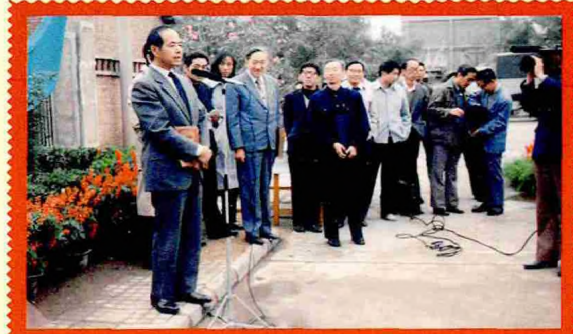
1986年10月17日，中国高等科学技术中心高能物理和同步辐射分中心成立。前排左起为李政道和叶铭汉（时任中国科学院高能物理研究所所长）。