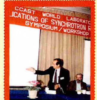
1988年5月，中国高等科学技术中心组织了“同步辐射的应用”国际学术研讨会，李政道致开幕词并作学术报告。