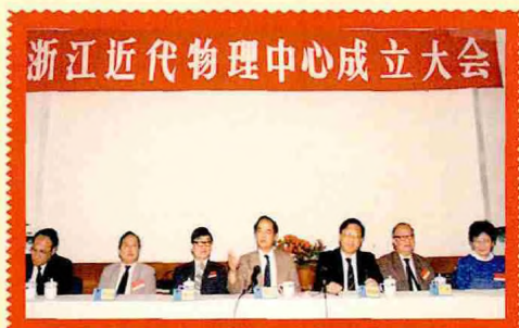
1991年6月6日，在李政道的倡议下，浙江近代物理中心在浙江大学成立，由李政道（左四）担任首届主任。