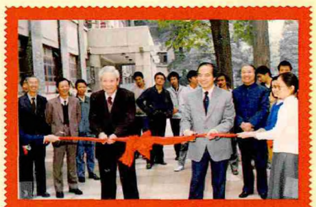
1992年4月，北京现代物理研究中心新址启用仪式在北京大学举行。照片为吴树青（时任北京大学校长，左）与李政道（右）为中心剪彩。