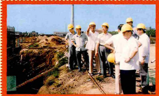
1985年6月，李政道（左四）视察北京正负电子对撞机工程工地。