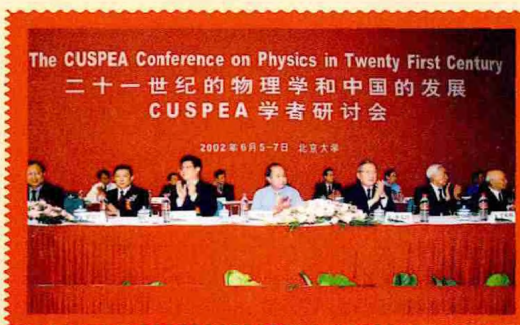
2002年6月5日，李政道出席在北京大学举办的CUSPEA学者研讨会。